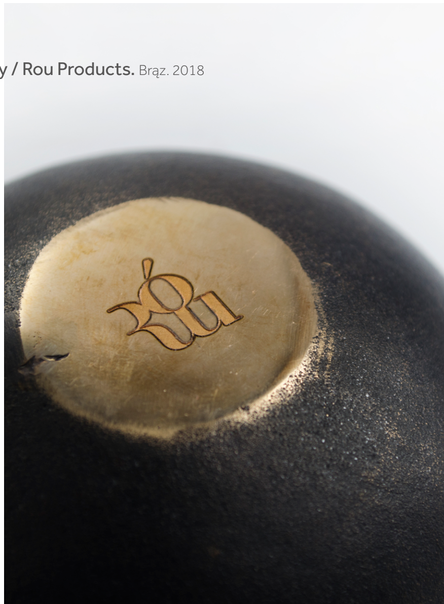
Organizery / Rou Products. Brąz. 2018

Organizer na przybory do pisania i akcesoria biurowe. Jest odlany z brązu, wedle tradycyjnych metod, patynowany z polerowanymi krawędziami. Technika wykonania, materiał i jego waga, czynią z niego wyjątkowy, wysublimowany obiekt. Ze względu na rzemieślniczy proces wytwarzania, każdy egzemplarz jest niepowtarzalny.