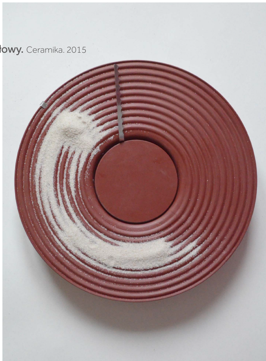
Zegar stołowy. Ceramika. 2015

Poziome zorientowanie tarczy zegara, skłania użytkownika do podejścia, refleksji lub podjęcia gry z czasem w pędzącym świecie. Daje możliwość wejścia w interakcję. Jest także polemiką z dawnymi zegarami kaflowymi.