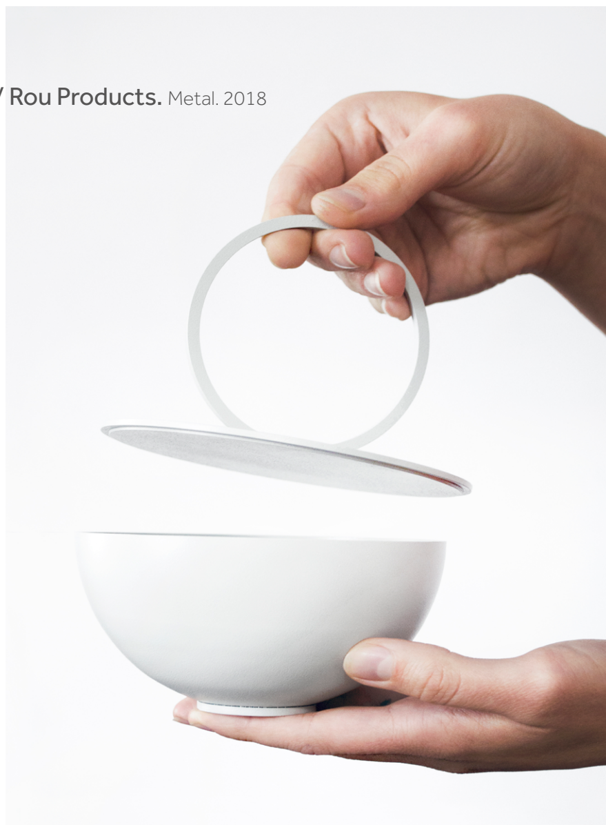
Baba Box / Rou Products. Metal. 2018

Baba Box to oryginalny pojemnik wykonany z malowanego proszkowo metalu. Z elegancją przechowa biżuterię i zorganizuje inne drobiazgi. Znak rozpoznawczy - przeskalowana obręcz - służy za uchwyt do podniesienia pokrywki. Występuje w dwóch rozmiarach.