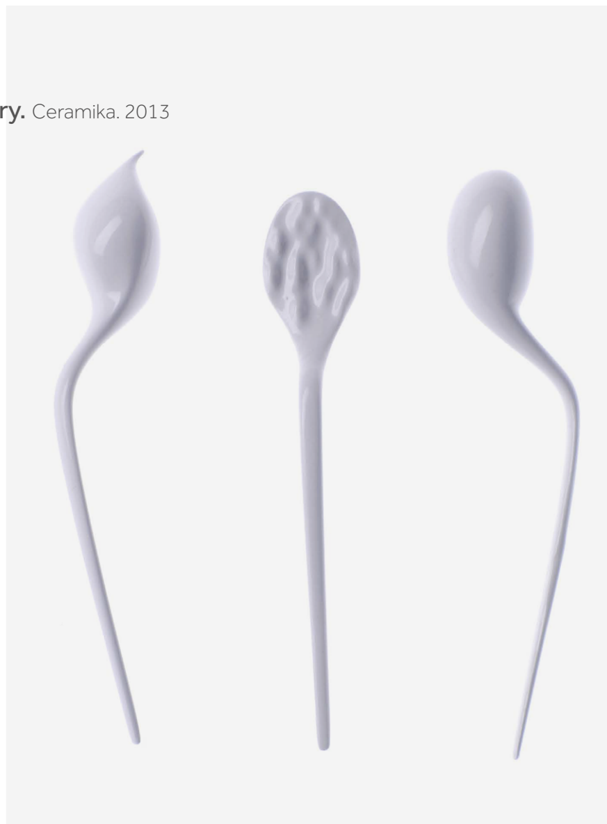
Delektatory. Ceramika. 2013

Jedzenie to przyjemność, a dzięki Delektatorom posiłek to uczta dla oka i podniebienia. Delektatory to przyrządy zaprojektowane tak, aby rutynowa czynność jedzenia stała się zupełnie nowym doznaniem.