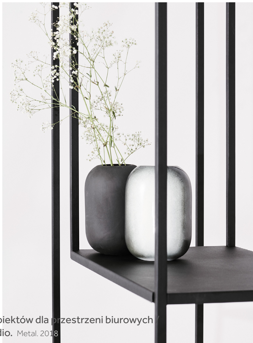
System obiektów dla przestrzeni biurowych Hopa Studio. Metal. 2018