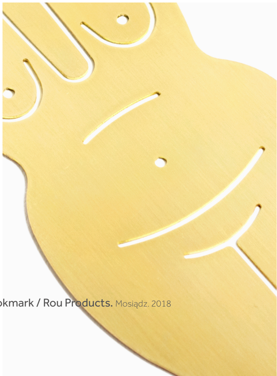
Venus Bookmark / Rou Products. Mosiądz. 2018

Venus Bookmark to wykonana z mosiądzu funkcjonalna i elegancka zakładka do książki. Forma Venus jest bezpośrednim odniesieniem do sztuki archaicznej i wyrazem adoracji naturalnego kobiecego piękna. Wsunęta między strony, zalotnie zerka na czytelnika.