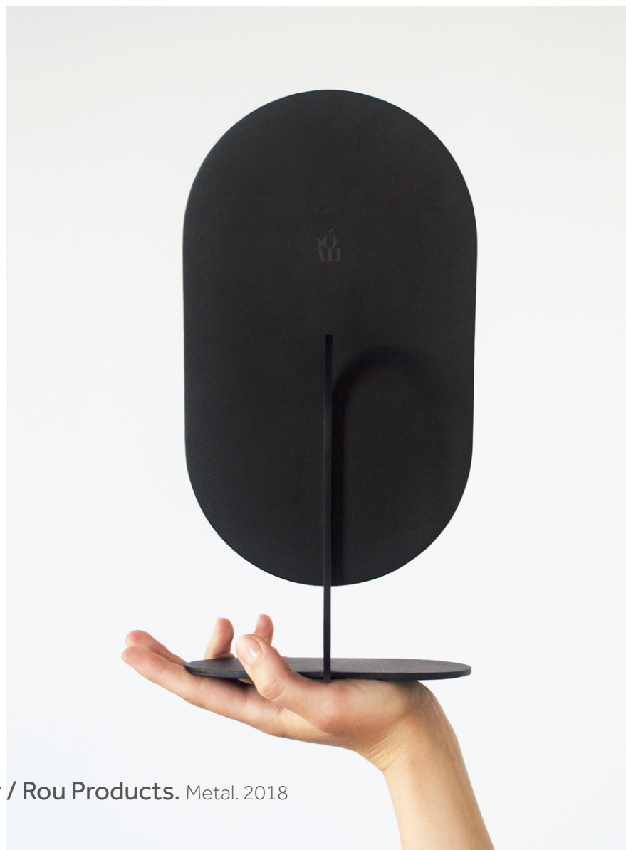
Soll Mirror / Rou Products. Metal. 2018

Minimalistyczna forma, u której podłoża leży rozważne i ekonomiczne zarządzanie materiałem. Kształt każdego kolejnego komponentu jest wynikiem poprzedniego, dzięki czemu strata materiału jest zminimalizowana. Uchwyt, będący jednocześnie „kręgosłupem” obiektu, pozwala na wygodne przeniesienie bądź przestawienie go, Soll Mirror jest wykonany z proszkowo malowanego metalu i srebrnego lustra.