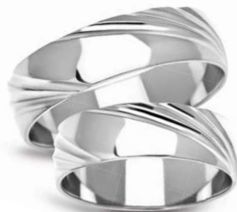
model 909W masa 7,45g szerokość 6mm