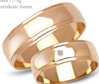
model 901K** masa 7,75g szerokość 6mm