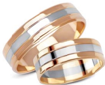
model 905 masa 7,75g szerokość 6mm