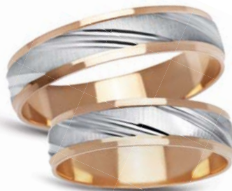
model 903 masa 6,15g szerokość 5mm