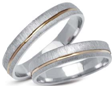
model 263 masa 7,4g szerokość 4mm

Złoto próby 0,585; przybliżona masa pary obrączek, **model z cyrkoniami, istnieje możliwość osadzenia diamentów Aktualne ceny: YES.pl