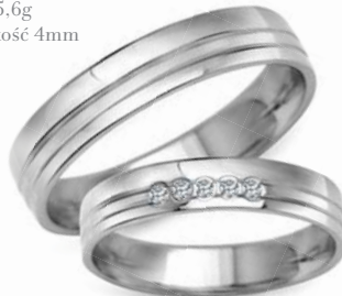
model 932WK** masa 5,6g szerokość 4mm