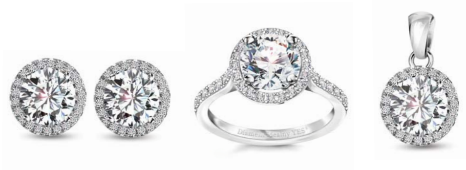
Kolczyki, pierścionek i zawieszka z Diamentem Idealnym YES®