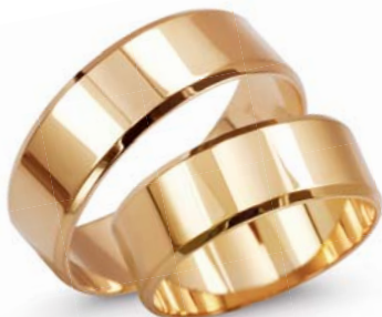
model 927 masa 9,3g szerokość 7mm