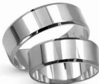
model 927W masa 9,3g szerokość 7mm