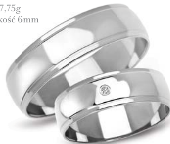
model 901WK** masa 7,75g szerokość 6mm