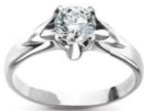
Pierścionek, kolczyki i zawieszka z brylantem Amore