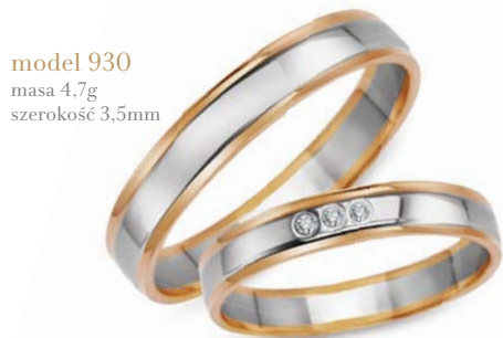
model 930 masa 4,7g szerokość 3,5mm