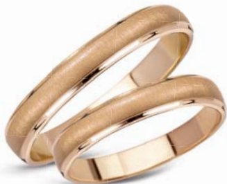
model 511 masa 5,5g szerokość 3mm