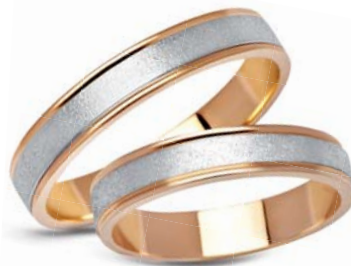
model 114 masa 8g szerokość 4mm