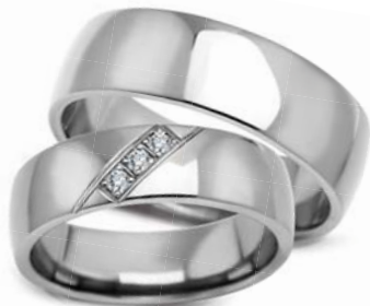
model 627K** szerokość 6mm