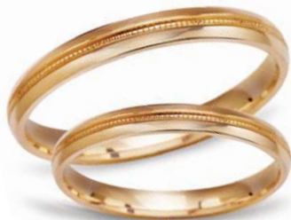
model 451* masa 4,6g szerokość 2,5mm lub 3,5mm