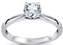
Pierścionek z brylantem Éternel