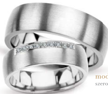
model 630K** szerokość 6mm