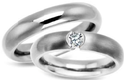
model 625K szerokość 5mm