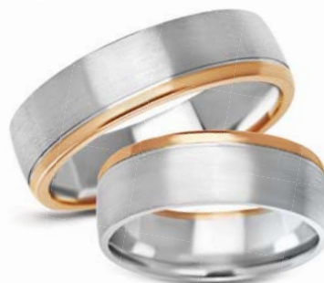
model 251 masa 13g szerokość 6mm