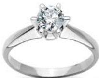
Pierścionek, kolczyki i zawieszka z brylantem Stella