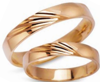
model 934 masa 4,2g szerokość 3,5mm