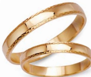
model 450* masa 4,6g szerokość 3mm lub 4mm