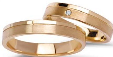
model 269K* masa 7,5g szerokość 4mm brylant 0,02ct – 1 sztuka