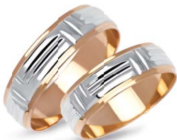
model 904 masa 6,75g szerokość 6mm