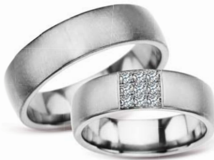
model 624K** szerokość 6mm