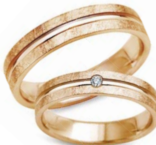
model 550* masa 7,5g szerokość 4mm