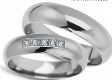
model 631K** szerokość 5mm