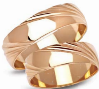
model 909 masa 7,45g szerokość 6mm