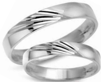
model 934W masa 4,2g szerokość 3,5mm